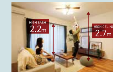
HIGH CEILING & HIGH SASH 天井高2.7mのリビングダイニングは、伸びやかな空間を演出します。