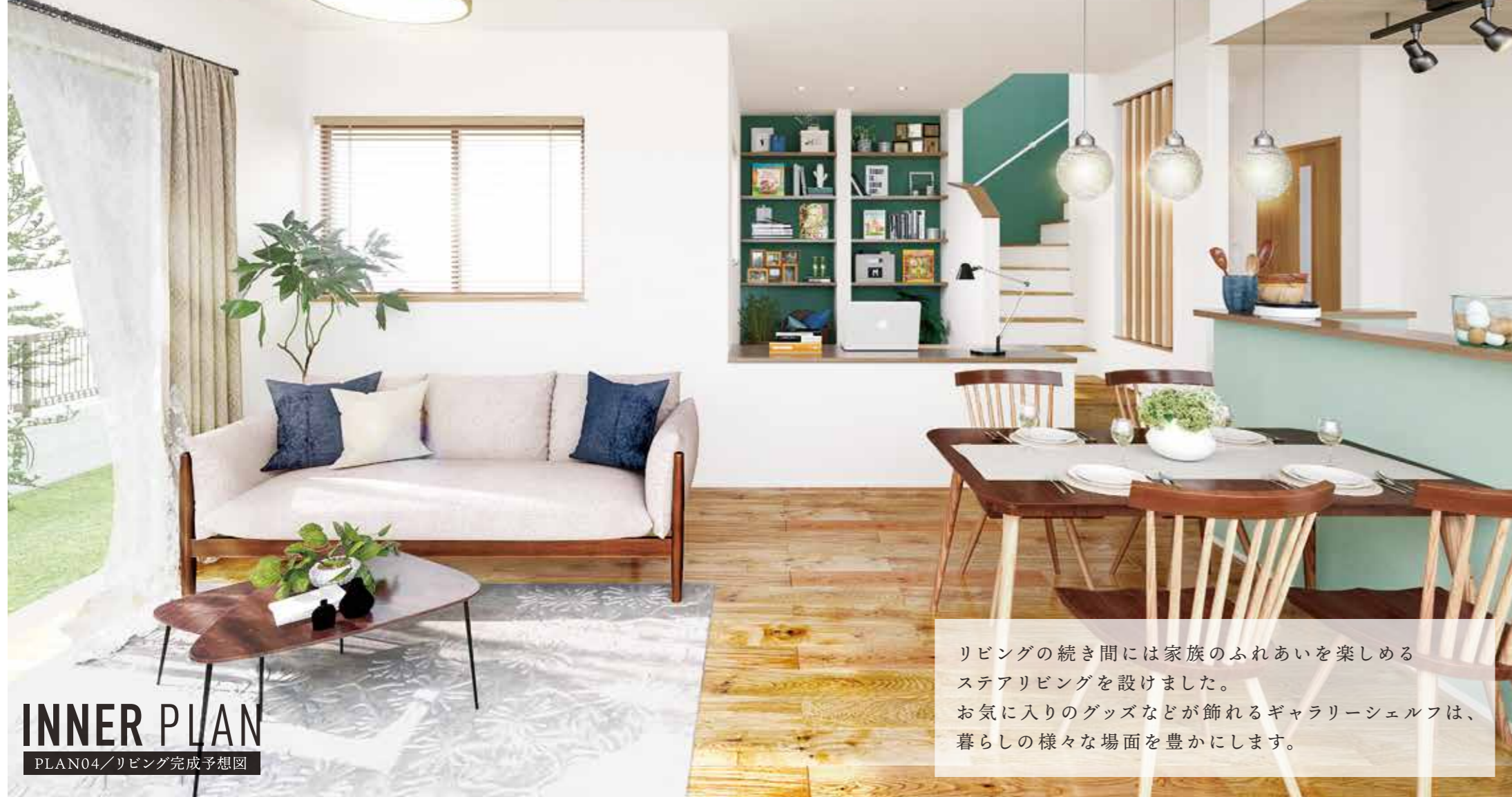
INNER PLAN PLAN04/リビング完成予想図

リビングの続き間には家族のふれあいを楽しめるステアリビングを設けました。お気に入りのグッズなどが飾れるギャラリーシェルフは、暮らしの様々な場面を豊かにします。