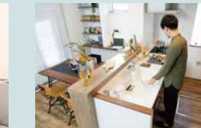
HIGH OPEN KITCHEN 開放的な対面式キッチン。家族の声や姿を感じられて安心して料理を楽しめます。

※リビング完成予想図は図面に描き起こしたもので実際とは多少異なります。※欄取りは計画図より作成の為、詳細に関しては設計図書・外構図にてご確認ください。※写真はイメージです。