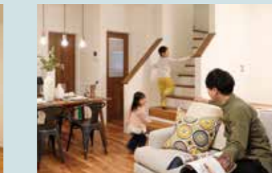
LIVING ACCESS お出かけもおかえりも必ずリビングを通るので、自然と会話が生れます。