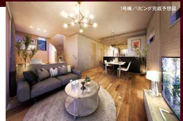
1号棟/リビング完成予想図