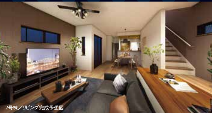
2号棟/リビング完成予想図

+土間クローゼット +パントリー+リネン庫 +ステアリビング +ウォークインクローゼット