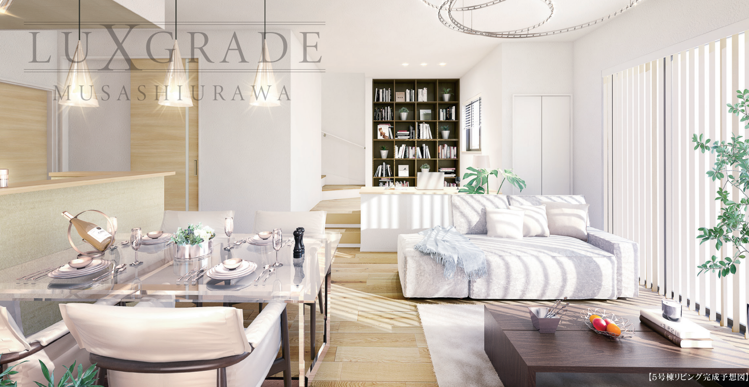
【5号棟リビング完成予想図】