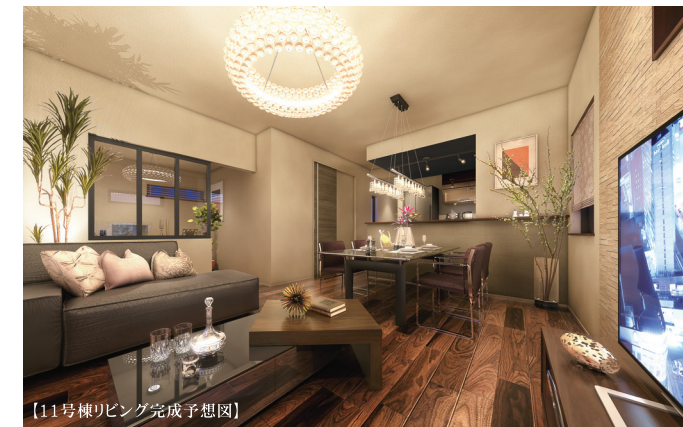
【11号棟リビング完成予想図】

ラグレード武蔵浦和 物件概要 ■所在地/さいたま市桜区田島3丁目1261番他(地番) ■交通/JR埼京線・JR武蔵野線「武蔵浦和」駅徒歩18分、JR埼京線「中浦和」駅徒歩11分、JR武蔵野線「西浦和」駅徒歩11分 ■総戸数/12戸 ■販売戸数/12戸 ■販売価格(税込)/4,680万円~5,980万円 ■最多価格帯/4,900万円台(3戸) ■土地面積/100.08㎡~120.13㎡ ■建物面積/93.15㎡~100.62㎡ ■道路/4.0m公道 ■私道持分/なし ■他共有持分/ゴミ置場3.62㎡×1/12 ■地目/宅地 ■用途地域/第一種住居地域 ■建ぺい率/60% ■容積率/160% ■構造/木造2階建(在来工法) ■設備/公営水道、東京電力・他、都市ガス、本下水、カーブス、外構、植栽、その他付帯設備一式 ■入居予定/2020年5月中旬 ■建築確認番号/第SJK-KX195628360号(2019年11月18日付)他 ■売主・設計/中央グリーン開発株式会社 ■施工/ポラテック株式会社 ※建ぺい率・容積率に関しては道路幅員、接道状況により数値が異なる場合がございます。※掲載の物件情報は2019年12月23日現在のものです。※広告有効期限/2020年2月末日