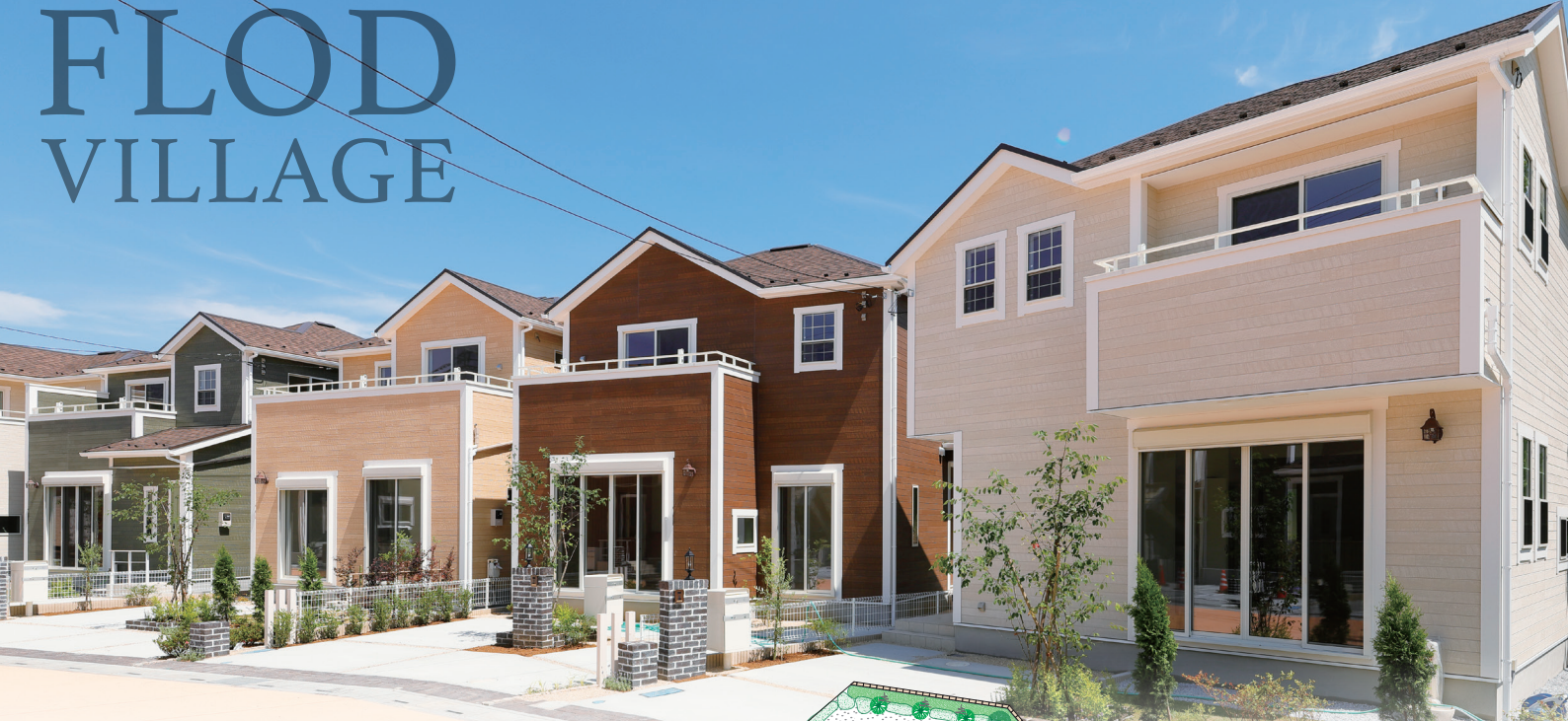
※街並み写真は2018年6月に撮影したものです。