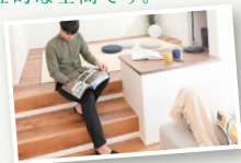
※1FスキップフロアDENイメージ

カウンターと書棚を配したDENを リビングと寝室にご用意しました。 様々な利用できる個性豊かな空間です。