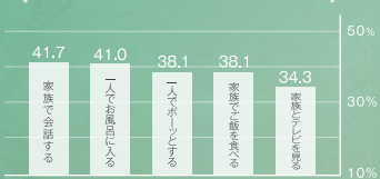
※対象: 女性312名 ※アットホーム調べ (2016年12月発表)