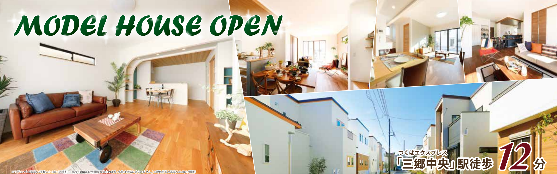
※モデルハウスの写真/25号棟:2018年10月撮影・1号棟:2018年12月撮影(写真中の家具・小物は価格に含まれません)※現地並み写真/2018年8月撮影