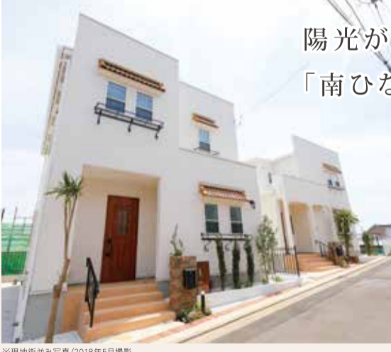
※現地写真/2018年5月撮影