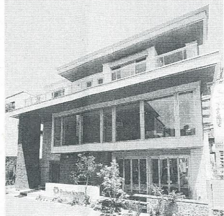
大和ハウス 馬込展示場 モデルハウスで提案

大和ハウス工業・東京本店(東京都千代田区、芳井敏一本店長)はこのほど、オリジナル防音室「奏でる家」に最新のゴルフシミュレーションを導入した「ダイワハウス馬込展示場」を東京都大田区にある馬込ハウジングギャラリーにオープンした。 「奏でる家」は、「狭い、低い、暗い」といった従来の防音室のイメージを見直し、「広く、高い天井、大きな窓のある明るさ」のある空間に一新。新築時に設計することで、低価格で快適空間にできるのが特徴。 世界的な名門ゴルフコースをはじめ47種類のラウンドが楽しめるほか、搭載する録画機能によりスイングモーションの確認なども可能。更に音楽鑑賞