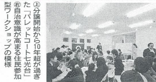
④分譲開始から10年超が過ぎた「パレットコート七光台」 ⑤自治意識が高まる住民参加型ワークショップの様相

分譲完了後のCSV(Creation & Shared Value)活動に力を入れている。 「コミュニティが希薄化 同地域は、92年に区画整理事業が始まり、同グループが04年から分譲を開始。14年に事業完了した全1035区画、約61万7000㎡の大規模分譲住宅団地「パレットコート七光台」の街並みが広がる。分譲開始から10年が過ぎた同団地でも、コミュニティの希薄化、自治会退会の増加といった社会問題が表面化。その課題解決に向けて、15年11月から地域の自治会と中央グリーン開発が共催して住民参加型ワークショップ「光葉町ミライ会議」を開始。これまで6回、延べ200人を超える住民主導の会議を重ねてきたという。 「働く場」といった3つの機能を果たしたコミュニティカフェとして具体化することになった。引き続き11月の開店を目指して、住民参加型DIYによる店舗内装のリノベーションに取り組み。