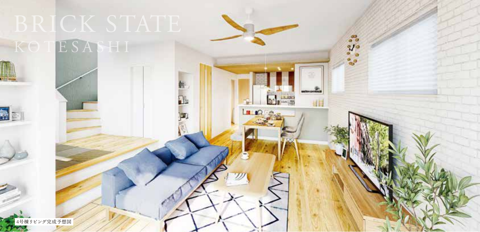
4号棟リビング完成予想図