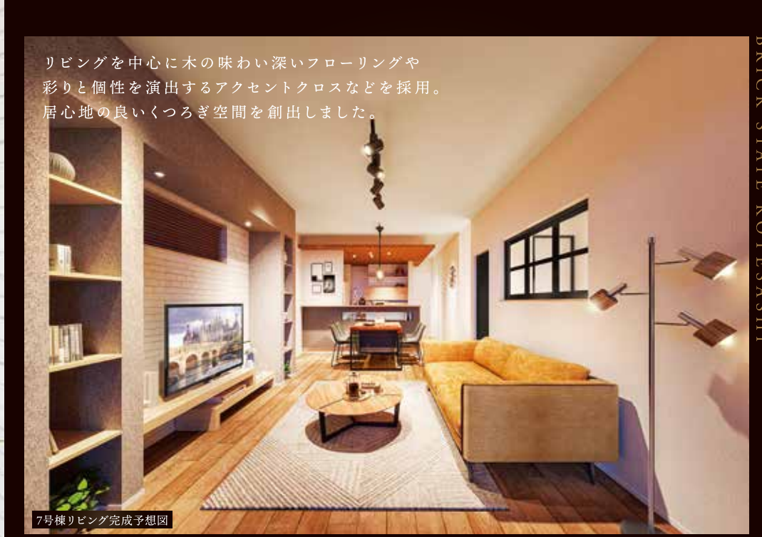
7号棟リビング完成予想図

リビングを中心に木の味わい深いフローリングや 彩りと個性を演出するアクセントクロスなどを採用。 居心地の良いくつろぎ空間を創出しました。