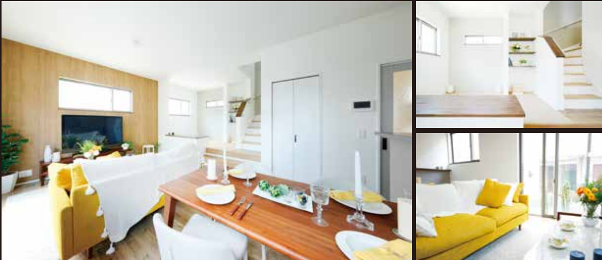
※掲載写真/現地モデルハウス8号棟(2021年5月撮影)、写真中の家具・小物は価格に含まれません。