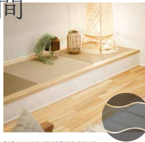
物と物、人と人のあいだにある繋がり、住まいにも。場と場を繋ぐことで人の関係性を緩やかに浮かび上がらせる「中間的領域」。