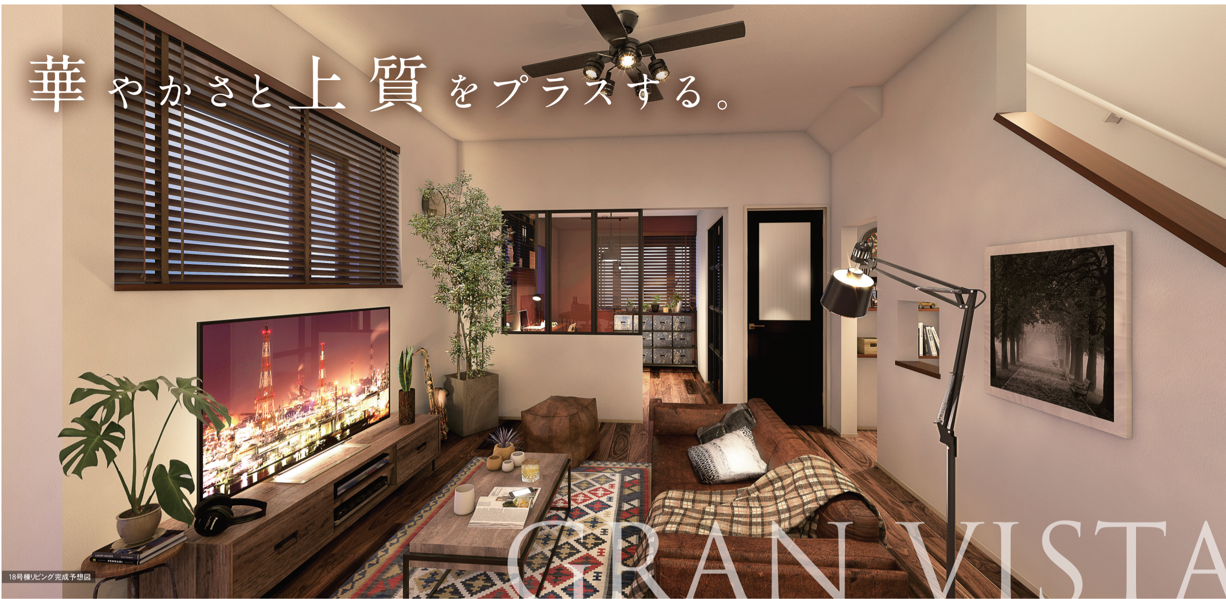
18号棟リビング完成予想図