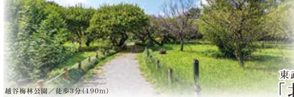
越谷梅林公園 / 徒歩3分(190m)