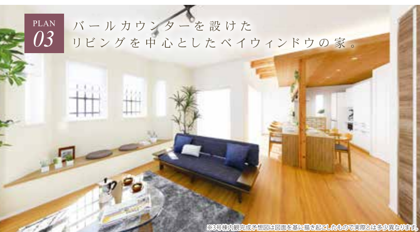
※3号棟内観完成予想図は図面を基に描き起こしたもので実際とは多少異なります。

PLAN 03 パールカウンターを設けた リビングを中心としたベイウィンドウの家。