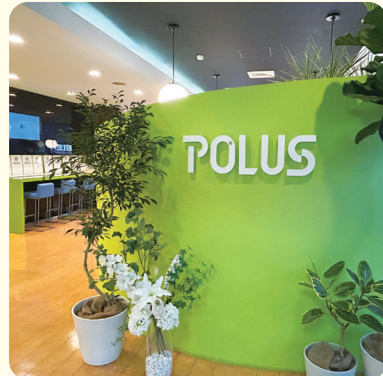
▲本店1階エントランス(越谷市)

住まいに関するさまざまなサービスを提供するポラスグループの一員として、住宅の設計・販売をしています。大きな土地をいくつかに分けて、たくさんの家を建てた「戸建て分譲住宅地」をつくり、そこに住む人や地域の人とその家・そのまちで、ずっと楽しく安心して暮らせるような「まちづくり」を心がけています。