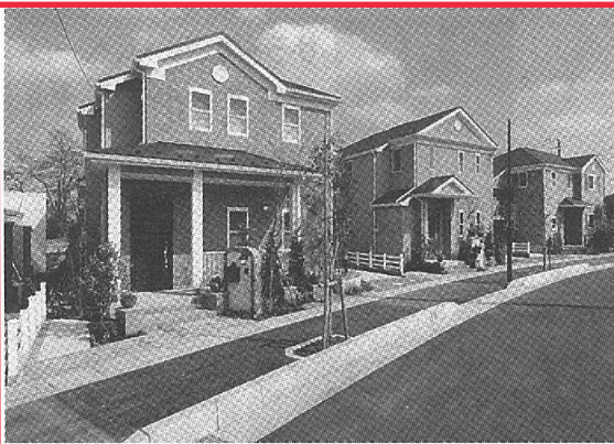
花や緑に包まれた暮らしができる美しいコミュニティ

ポラスグループ・中央の各住戸のプランが評価 グリーン開発(本社・さいたま市)です。 埼玉県越谷市、代表・中内慶太郎)では、埼玉県は、ポラスグループの中 さいたま市緑区の都市計でも大規模分譲を得意と 画区域内に、全棟1300㎡以上あり、「パレットコ 以上の敷地を確保した 99棟の大型戸建分譲住宅 『パレットコート浦和 緑花未来区(のよ)かみ ら』第2期43棟の販 売を、9月中旬から開始 する(こ)になりました。 第1期は4月18日よ 販売を始め、昨今の厳し 住宅市況にもかかわらず 56棟に対し52棟が契約 済みとなっています。 販売好調の要因は、今 回の住宅地の街並みや景 観の美しさや生活提案型 です。 街づくりに際し同社が 重視するのは「景観」環 境」「コミュニティ」 「パレットコート浦和 緑花未来区」概要 ○所在地:埼玉県さいた ま市緑区三至南宿土地 区画整理事業2街区2 画地他(保留地) ○総戸数:99棟 ○開発総面積:14,347.25㎡ ○販売価格:3,480 万円/4,995万円 (1期分) ○主な設備:公営水道 東京電力、都市ガス 下水、カーブス、 外構、植栽その他付帯 設備一式 ○ポラスグループ 中央 グリーン開発(株)048 (990)8010 今回の分譲地「パレッ トコート浦和 緑花未来 区」も、この開発思想に 沿って作られており、「緑 を愛する」「散策を楽しむ」 「6つのストーリー」 「75坪」~「142.76坪」 (38・25坪)(1期分) ○間取り:2(3)LD K54(5)LDK1 期分) ○販売価格:3,480 万円/4,995万円 (1期分) ○主な設備:公営水道 東京電力、都市ガス 下水、カーブス、 外構、植栽その他付帯 設備一式 ○ポラスグループ 中央 グリーン開発(株)048 (990)8010